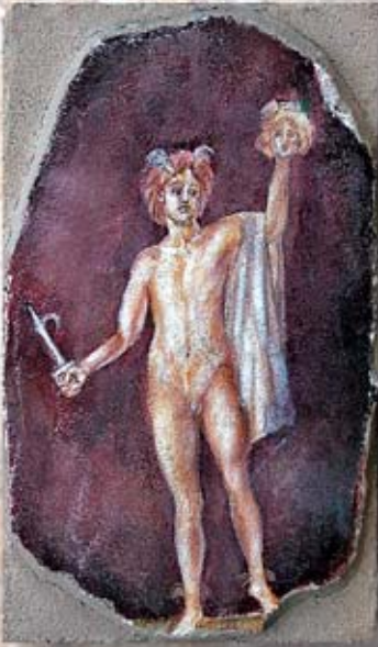
PERSEO cm. 35x20 - 14"x 10"