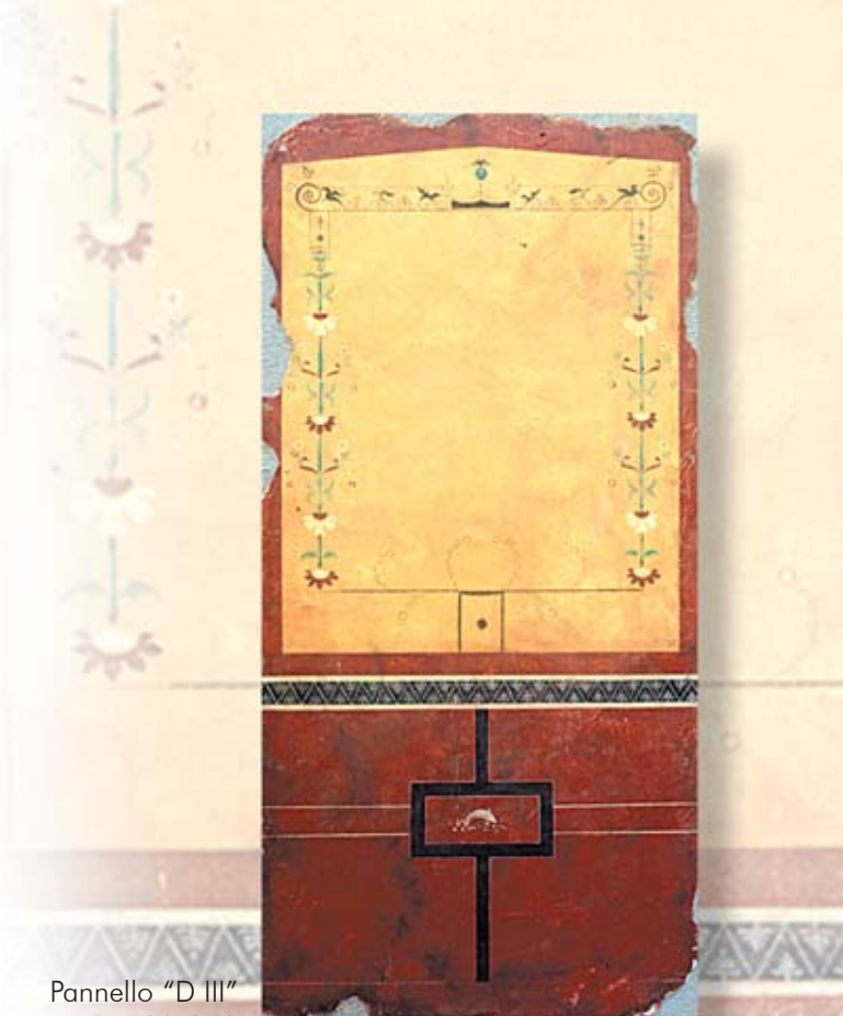
Pannello "D III" cm. 120x240 47.24"x 94.48"