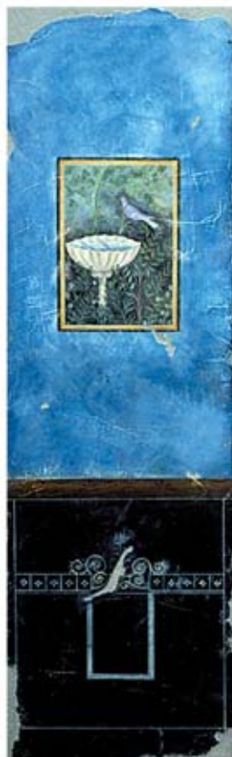
Pannello "AD I" cm. 80x240 31.49"x 94.48"