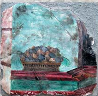
CISTA cm. 30x30 - 12"x 12"