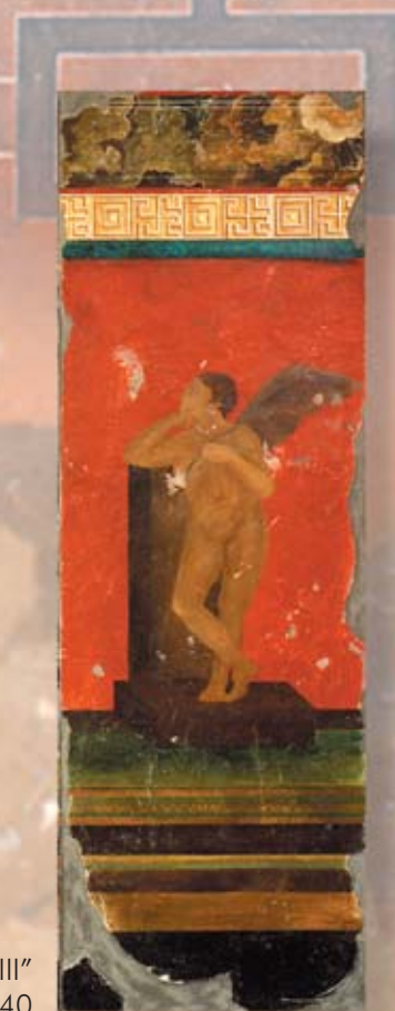
Pannello "D III" cm. 80x240 31.49"x 94.48"