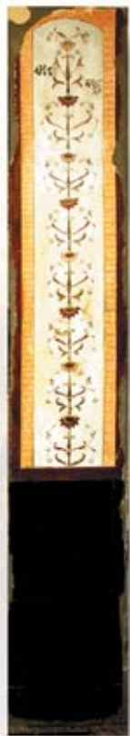
Pannello "F" cm. 40x240 15.74"x 94.48"