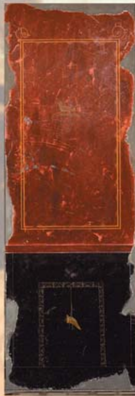
Pannello "SD" cm. 80x240 31.49"x 94.48"