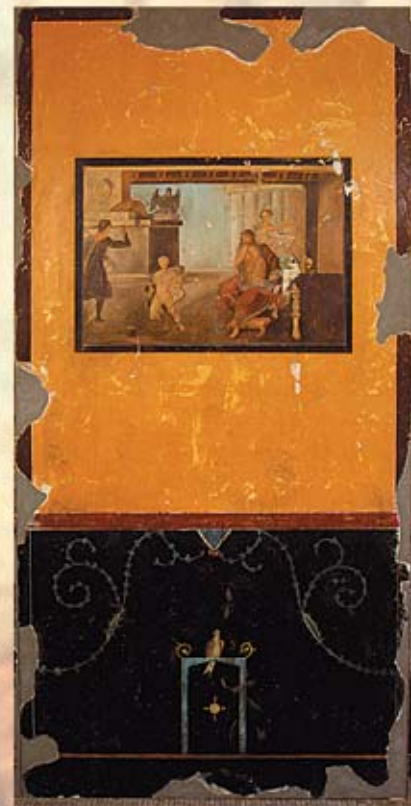
Pannello "D II" cm. 120x240 47.24"x 94.48"