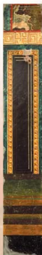
Pannello "AD II" cm. 40x240 15.74"x 94.48"