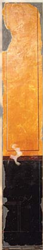
Pannello "SS" cm. 40x240 15.74"x 94.48"