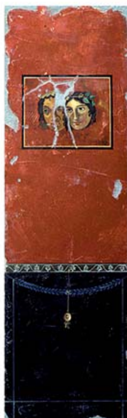
Pannello "SD" cm. 80x240 31.49"x 94.48"