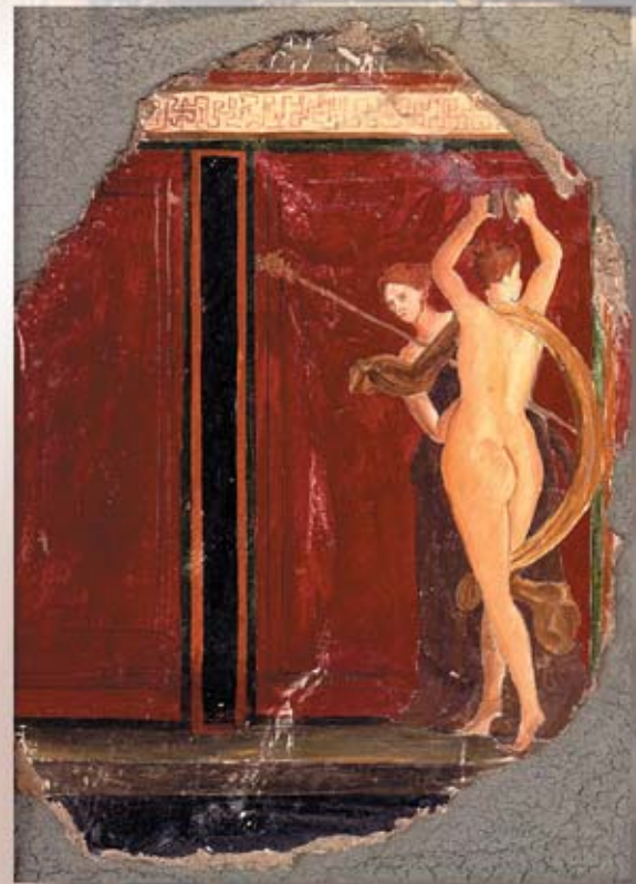
CASA DELLE NOZZE cm. 60x80 - 23,62"x31.49"