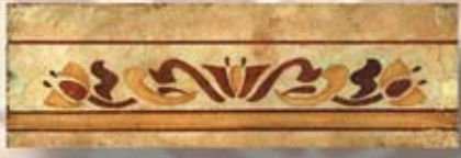
CAMPANIA cm. 10x30 - 4"x 12"