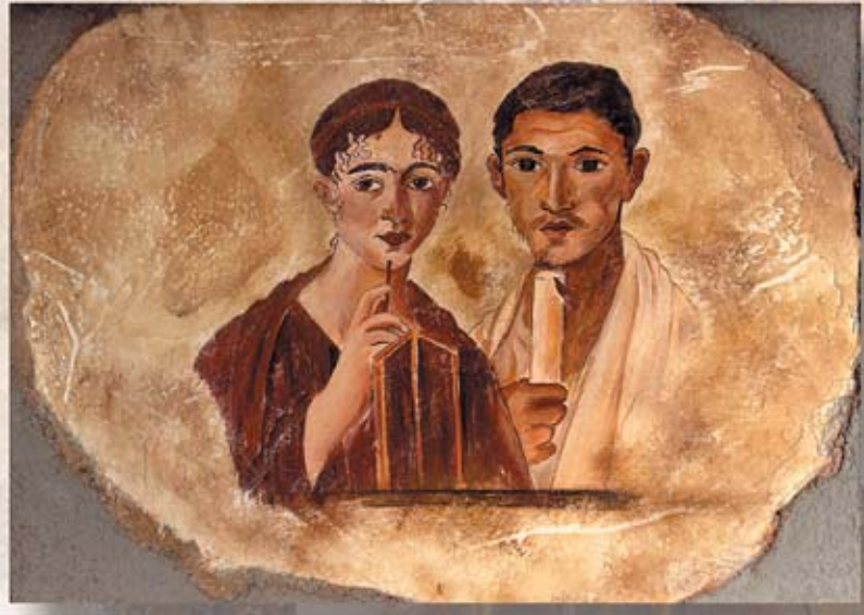
CASA VII cm. 100x70 - 39.37"x27.54"