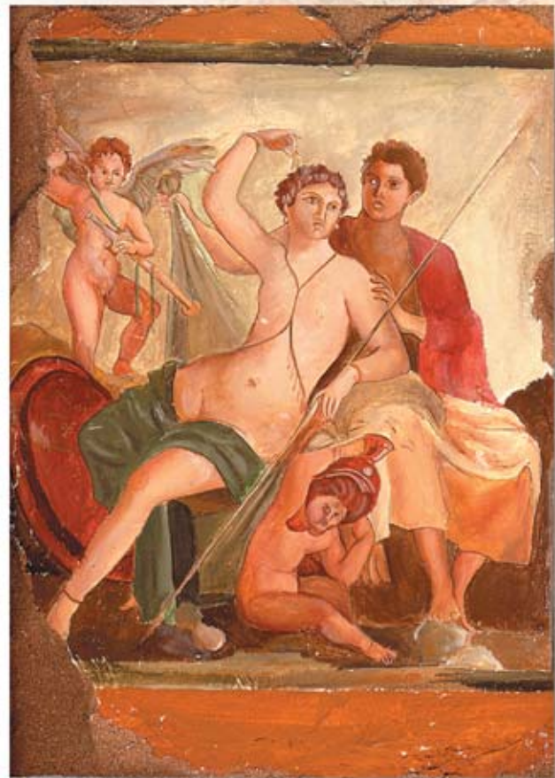
CASA DI APOLLO cm. 70x120 - 27.55"x47.24"