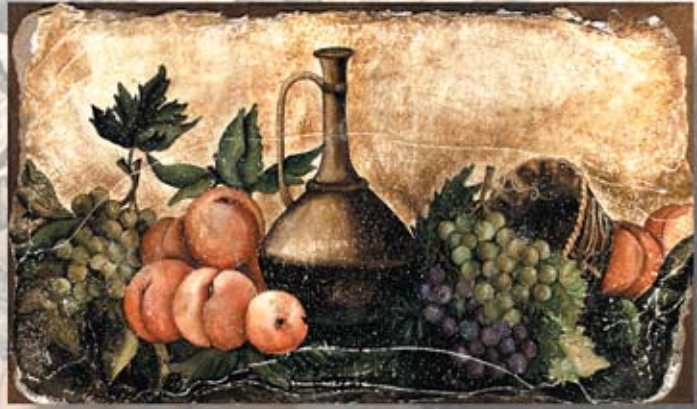
NATURA cm. 60x35 - 24"x14"