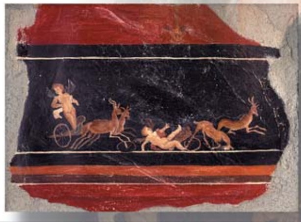
CASA DI PANSA cm. 50x40 - 19.68"x15.74"