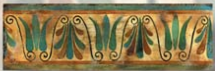
LUCANIA cm. 10x30 - 4"x 12"