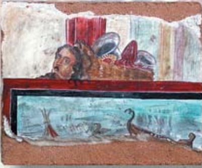
OCEANUS cm. 25x30 - 9"x 12"