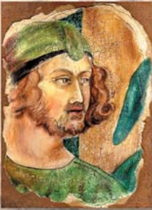
POTENS cm. 35x25 - 14"x 9"