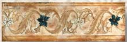
TUSCANIA cm. 10x30 - 4"x 12"