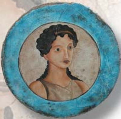
MATER Ø cm. 40 - 15.74"