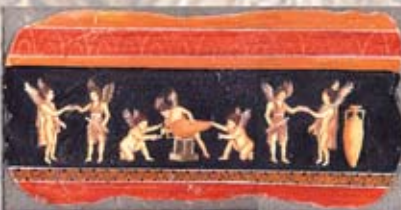
CASA DEL CHIRURGO cm. 30x25 - 11.81"x 9.84"