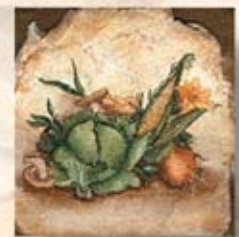
FRUTTA DI VERDURA cm. 15x15 - 6"x 6"