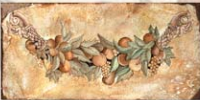
OPULENTIA cm. 15x30 - 6"x 12"