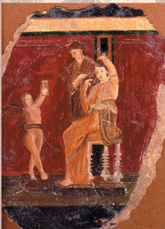
CASA DELLE DANZATRICI cm. 50x70 - 19.68"x 27.55"