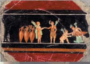
CASA DEL CHIRURGO cm. 30x25 - 11.81"x 9.84"