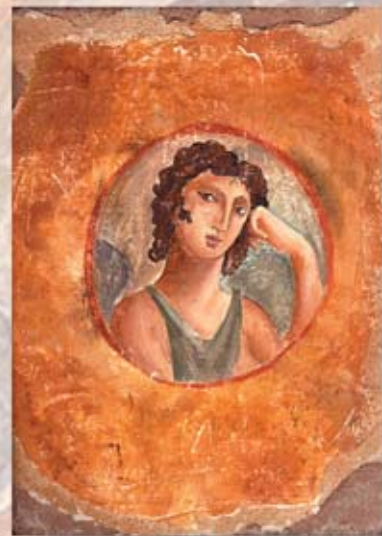
CASA DEL SATURNINO cm. 40x50 - 15.74"x19.68"