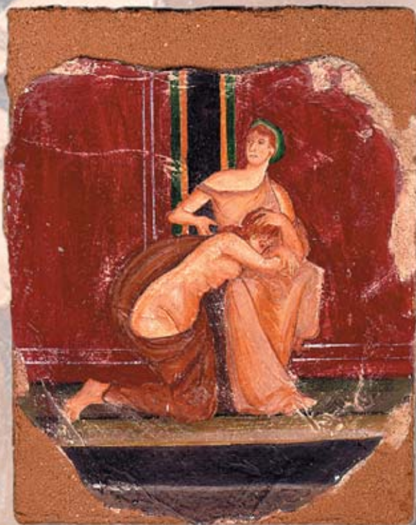
CASA DEL POETA cm. 50x70 - 19.68"x27.55"