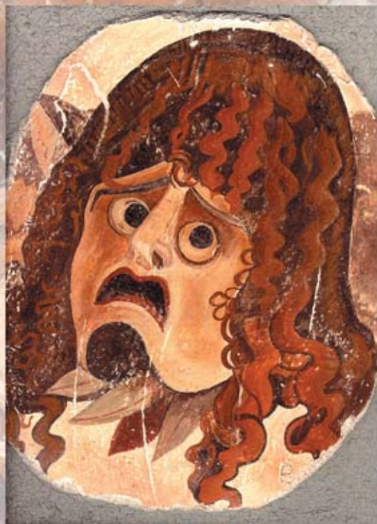
CASA DEL FAUNO cm. 50x70 - 19.68"x 27.55"