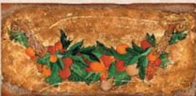
OPULENTIA II cm. 15x30 - 6"x 12"