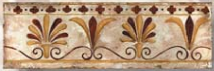
PADANIA cm. 10x30 - 4"x 12"