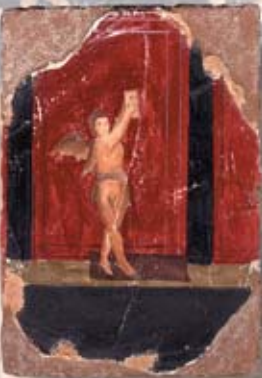
CASA DEL FORNAIO cm. 25x30 - 9.84"x 11.81"