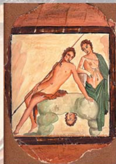
CASA DI ATTEONE cm. 40x50 - 15.74"x19.68"