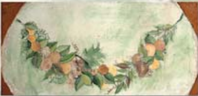
CASA DEL FRUTTETO cm. 15x30 - 6"x 12"