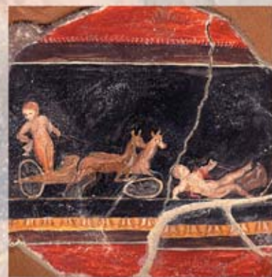
CASA DEI DIOSCURI cm. 40x40 - 15.74"x31.49"