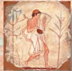
MUSICUS cm. 15x15 - 6"x 6"