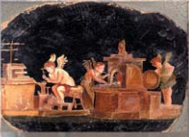
CASA DEI VETTI cm. 30x25 - 11.81"x 9.84"