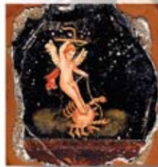
CANCER cm. 15x15 - 6"x 6"