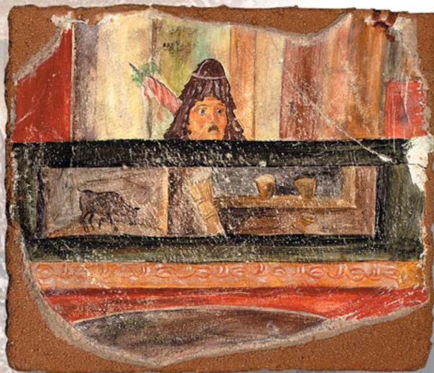
CASA DELLE MUSE cm. 90x70 - 35.43"x27.55"