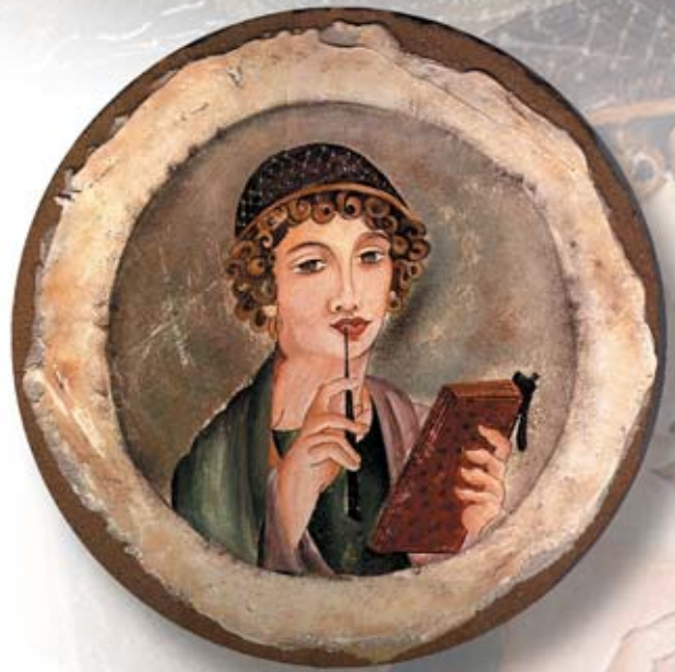
CASA DI DIOMEDE cm. 50x50 - 19.68"x19.68"