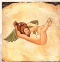
ANGELO cm. 15x15 - 6"x 6"