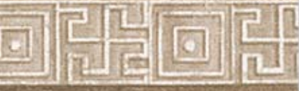
CASA DEL CHERUBINO cm. 20x20 - 8"x 8"