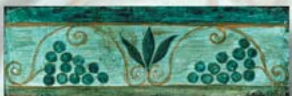
ETRURIA cm. 10x30 - 4"x 12"