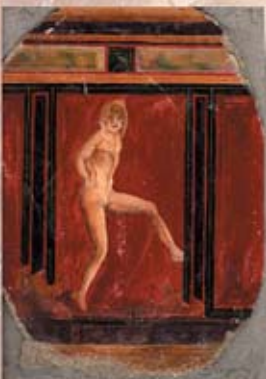
CASA DI LOREIO cm. 25x30 - 9.84"x 11.81"