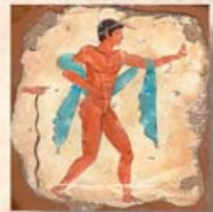
BELLUS cm. 15x15 - 6"x 6"