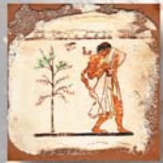
FIGURA cm. 15x15 - 6"x 6"