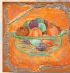
FRUCTUS cm. 15x15 - 6"x 6"